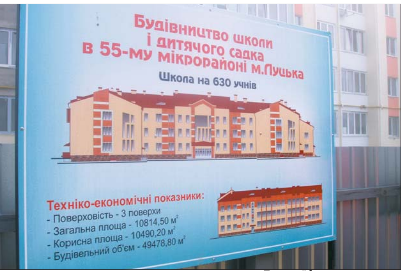
План майбутнього комплексу