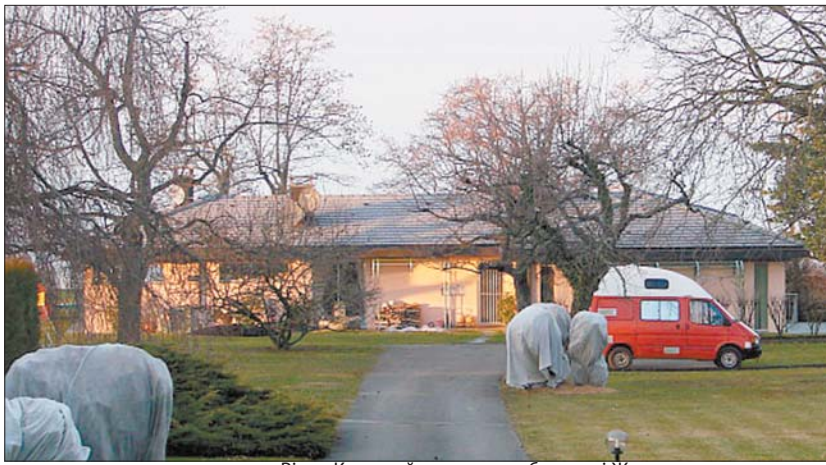
Вілла Коломойського на узбережжі Женевського озера

Мерія виявилася зачиненою. Церква також. Решта будівель тут — це приватні вілли. Значна частина з них стояли порожніми. Їхні власники зазвичай приїжджають сюди, коли потеплішає. В інший час на ву-