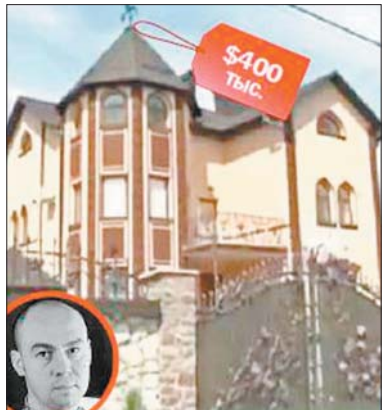
Будинок мера Тернополя

орендованій «двушці» в центрі міста — біля Галицького райвідділу міліції Львова. Каже, що на роботу часто ходить пішки — до обласної адміністрації неспішним кроком хвилин 15. За 60 «квадратів» у польському будинку платить на місяць три тисячі гривень. Губернатор каже, що шукає нову квартиру побільше, щоб до нього могла приїхати дружина (до Львова його перевели з Тернополя, де в нього є великий двоповерховий будинок за містом). За словами Цимбалюка, якщо його відвідала родичка з Бостона й жажнулася, що він живе, як на вокзалі.