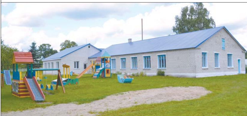
Садочок у Забродах добудували і майданчик для ігор облаштували

Активність громади — велика сила. Це довели жителі Забродівської сільради, що в Ратнівському районі, які завдяки виграним грантам реконструювали два ФАПи та добудували садочок. Загалом Забродівська сільська рада спільно з громадою розробила та подала для участі в різних конкурсах 14 проектів. Загальна вартість уже втілених проектів і тих, що наразі реалізуються, складає майже 1,5 мільйона гривень.