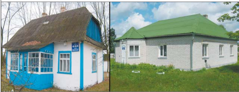
ФАП у Лучичах: до і після реконструкції

Втішені неймовірними результатами забродівчани подали ще один проект — «Поточний ремонт приміщення ФАПу с. Заброди з впровадженням енергозберігаючих технологій». Але в його фінансуванні було відмовлено — через перевищення допустимої кількості затверджених проектів на одну громаду.