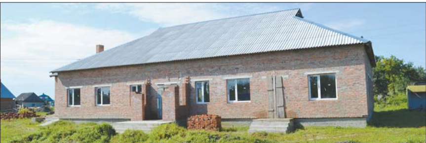
Незавершений соціально-культурний центр у Карпилівці

Одним із важливих завдань ПТНЗ є також підготовка робітників із числа незайнятого населення за замовленням служби зайнятості. Однак у I півріччі 2011 року робітників професію за кошти Фонду соціального страхування на випадок безробіття отримали лише 66% безробітних громадян.