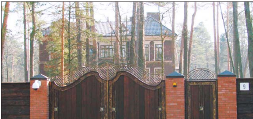
Маєток нинішнього керівника ДУС