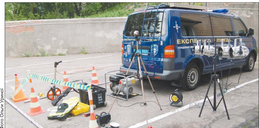
Пересувна лабораторія з проведення автотехнічної експертизи на місці ДТП