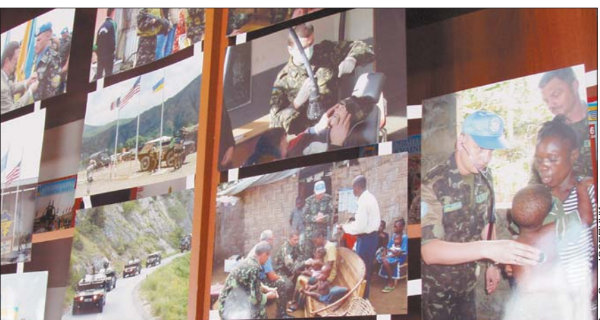
Фотовиставка у ліцеї з посиленою військово-фізичною підготовкою

Сьогодні Тижень подружжя вже святкують у 15 країнах світу. Серед них, окрім України, — Ірландія, Англія, Німеччина, Румунія, США, Угорщина, Італія, Австралія, Словаччина, Нідерланди, Швейцарія. Подекуди це свято набуло національного масштабу.