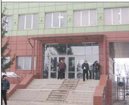
Вхід до нового митного поста «Луцьк»