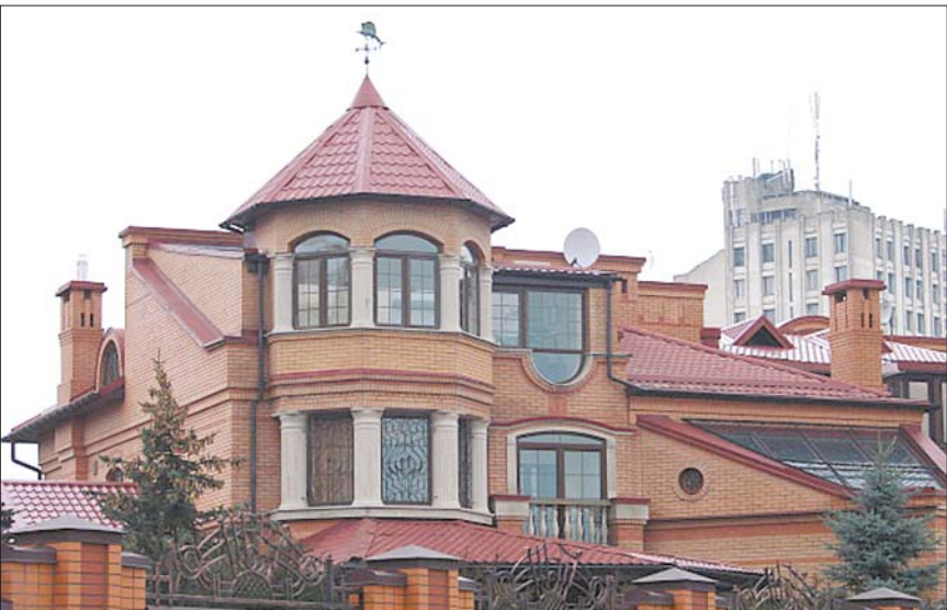
Так живе колишній Генпрокурор

За матеріалом Сергія Лещенка для «Української правди»