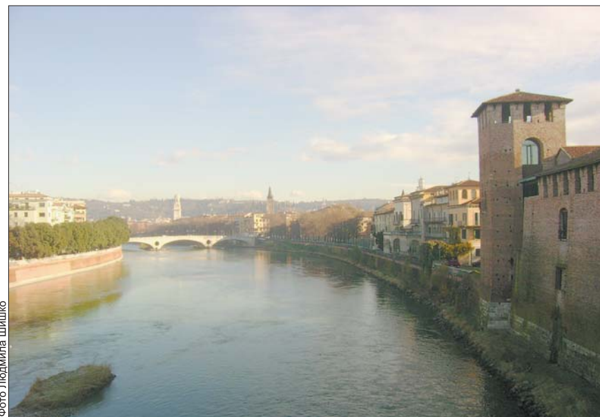
Верона розташована на берегах річки Адідже

В аеропорту Мілана польський товариш узяв напрокат машину, й ми вирушили до Верони. В Італії діс-