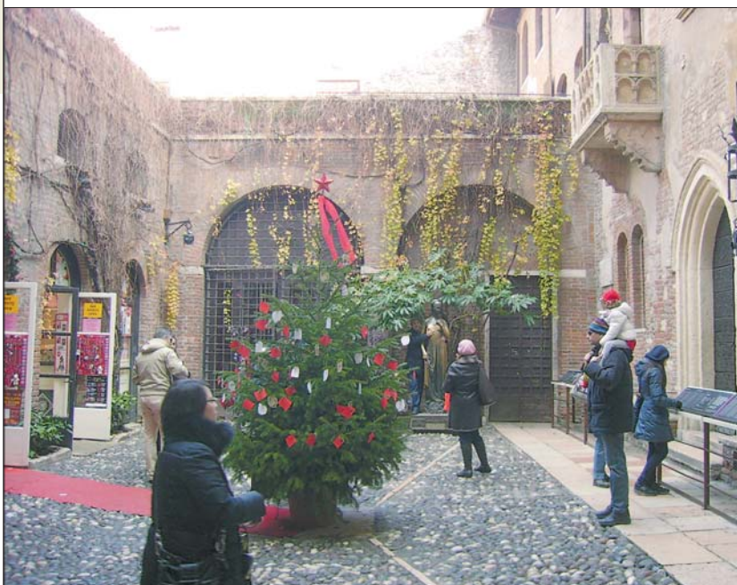
Будиночок Джульєтті у Вероні

буть, багато й туристів. Незважаючи на те, що досить прохолодно, приблизно 0°C, безліч кафе й ресторанів пропонують відвідувачам столики просто неба. А для тих, хто вже дуже замерз, продають, також на вулиці, гаряче вино. Склянка коштує два євро, але напій справді смачний